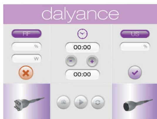
Pantalla táctil fácil de utilizar, con modo guiado que ayuda al usuario a lo largo del proceso

dalyance cuenta con una interfaz muy intuitiva que permite facilitar el trabajo del usuario acortando el tiempo de aprendizaje y ayudando a obtener el máximo rendimiento del equipo.